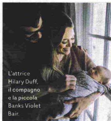
L'attrice Hilary Duff, il compagno e la piccola Banks Violet Bair.

L'ha provata anche Hilary Duff, appena diventata mamma per la seconda volta: al Caioti Pizza Café di Los Angeles, prima del parto, l'attrice 31enne ha ordinato un'insalata composta da lattuga romana, crescione, noci, gorgonzola, vinaigrette al balsamico e una miscela segreta di erbe. Negli Stati Uniti la chiamano "maternity salad" e la conoscono come l'insalata che induce il travaglio. Ma non c'è nessuno studio scientifico che dimostri la sua efficacia. Funziona, invece, un po' di movimento leggero, che avvicini il bambino al canale del parto: salire le scale o camminare, ad esempio. Molti ospedali consigliano alla futura mamma di rimbalzare delicatamente sulla gym ball con le gambe allargate. E di non rinunciare ai rapporti sessuali: lo sperma contiene prostaglandine che aiutano a dilatare il collo dell'utero. Quella della «maternity salad», insomma, è solo una leggenda metropolitana.