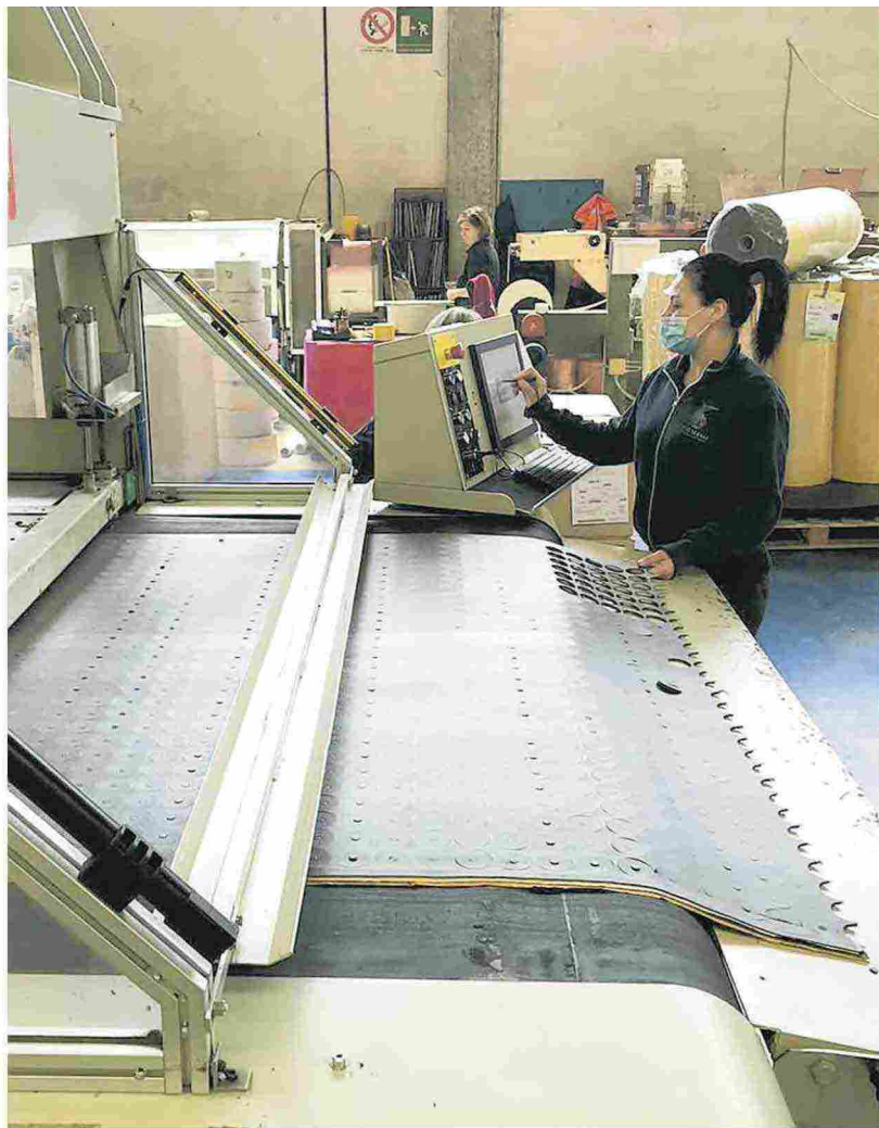
▲ Al lavoro La Cf Italia è specializzata in isolanti acustici

manti e di ampliare la propria gamma di prodotti e materiali impiegati e, quindi, essere all'altezza di soddisfare nuove esigenze e mercati. Da un anno circa, l'azienda può contare su una nuova linea di produzione con cui rifornisce tre stabilimenti, uno in Italia e due all'estero (Francia e Polonia). Ulteriori investimenti sono previsti per migliorare le linee produttive attuali e introdurre di nuove.