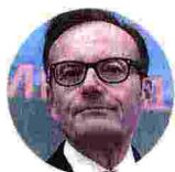
Massimo Carboniero Presidente Ucima

«L'industria metalmeccanica è trainante nel guidare, attraverso le tecnologie digitali Industria 4.0, la trasformazione del settore manifatturiero verso il miglioramento della competitività. Per la riapertura chiediamo di considerare esclusivamente il criterio della sicurezza e l'importanza dell'intera filiera di chi opera per il sostegno e l'efficacia del settore. Aperture parziali rischierebbero di creare una nuova paralisi e l'impossibilità di chi produce e fornisce tecnologie abilitanti di portare beneficio ed innovazione»