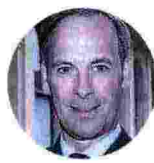
Marco Nocivelli Presidente Anima

«La salute dei lavoratori è un valore per l'azienda e la ripresa delle attività è di vitale importanza per la tenuta occupazionale. La meccanica agricola sta registrando un crollo della produzione e del mercato (-35% le trattrici a marzo), e sta perdendo quote all'estero. Abbiamo lavorato decenni per conquistare una leadership globale ma bastano pochi mesi per essere scalzati da Paesi che hanno continuato a produrre»