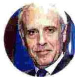
Paolo Scudieri Presidente Anfia

«Ogni giorno di lockdown causa danni enormi a tutta la filiera: vediamo perdite di fatturato dell'ordine del 30-50% nel mese, l'export cala del 10%. Il rischio di non rialzarsi più è reale. In queste settimane di lockdown le aziende della meccanica si sono preparate per lavorare in sicurezza, applicando misure spesso ancora più stringenti di quelle indicate dalle autorità. Ora è tempo di farci ripartire»