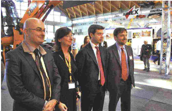
Il Ministro dell'Ambiente Andrea Orlando presente a Ecomondo

retto è stato il business delle imprese, l'unità di misura inequivocabile dell'efficacia di una manifestazione fieristica".